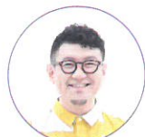
サポートゲスト タバティ

「どうして大きな音でブザーがなるの?」「どうして暗いの?」… 答えがわかれば劇場は楽しい!!